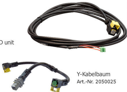
Y-Kabelbaum Art.-Nr. 2050025