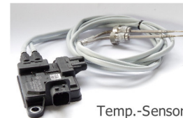
Temp.-Sensormodul Art.-Nr. 2050045