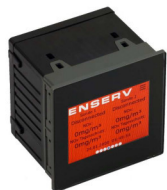
NOxGUARD unit Art.-Nr. 2050001