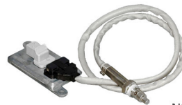
NOx-Sensormodul Art.-Nr. 2050050